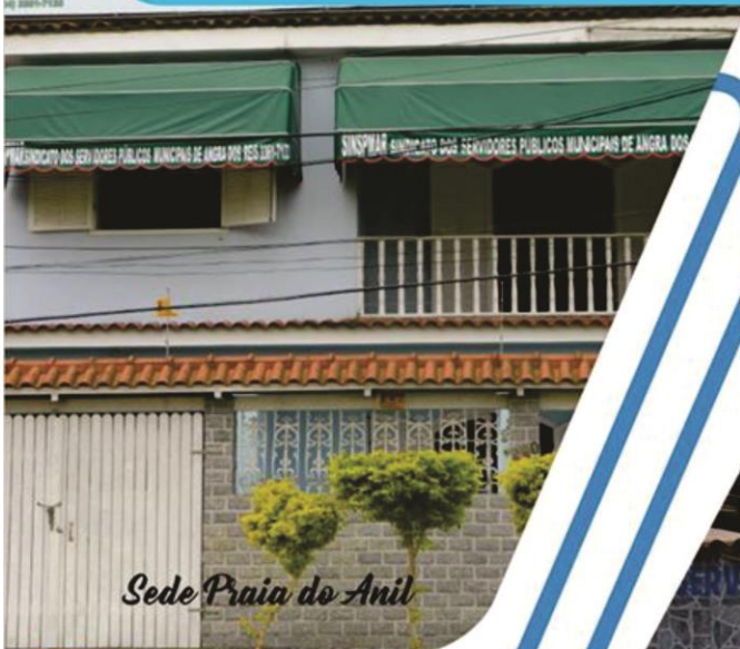
Sede Praia do Anil